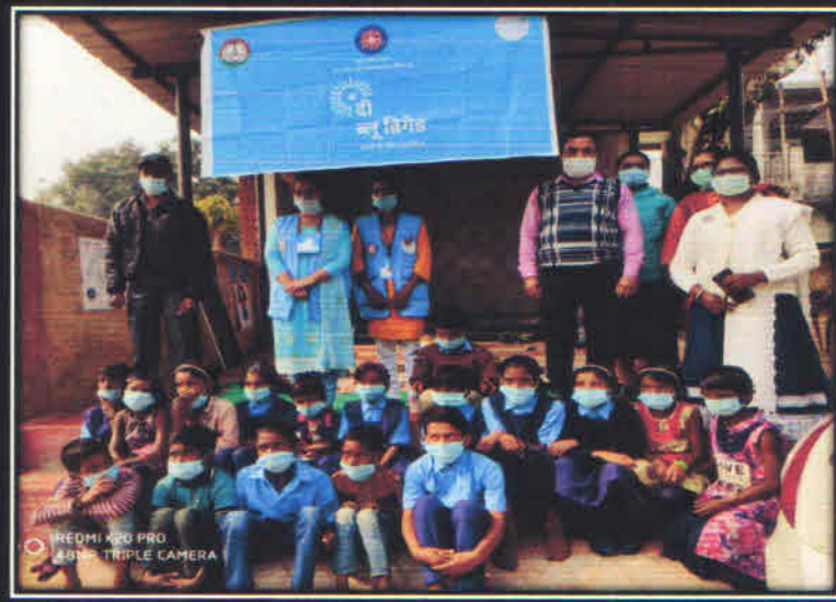
स्वास्थ्य केन्द्र में सुरक्षित प्रसव