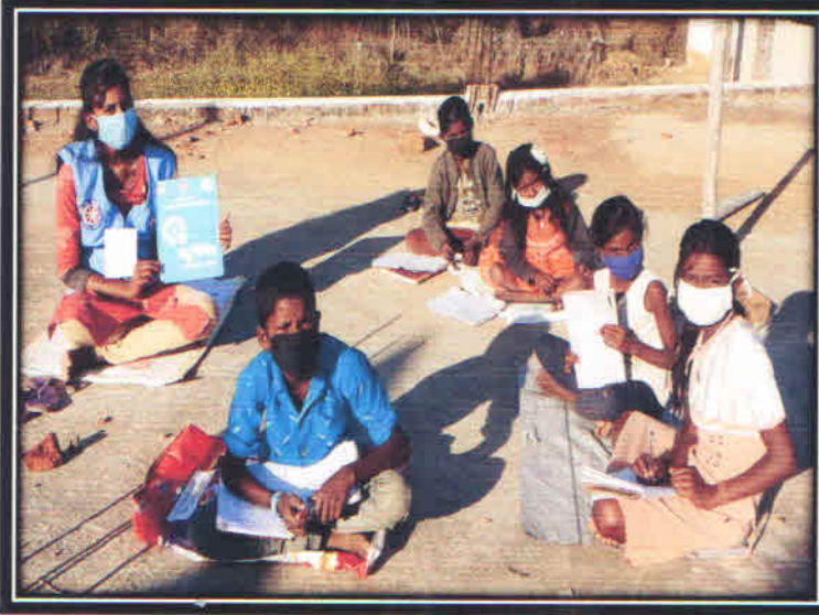
गुड टच बैड टच की जानकारी