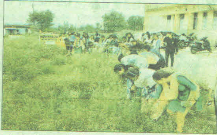
कालेज परिसर में साफ-सफाई करती छात्राएं।

पंडो बस्ती में डोर टू डोर संपर्क: बुधवार को शासकीय नवीन कन्या महाविद्यालय की छात्राओं द्वारा ग्राम शंकरपुर पंडो बस्ती