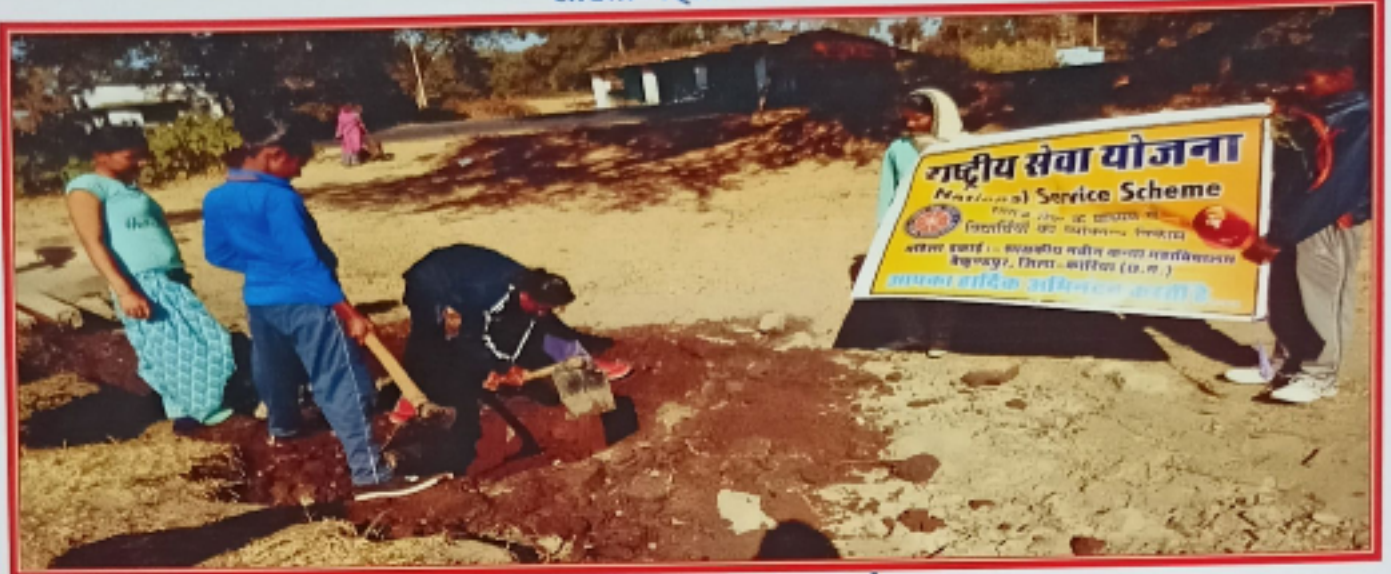
हनुमान मंदिर परिसर की सफाई