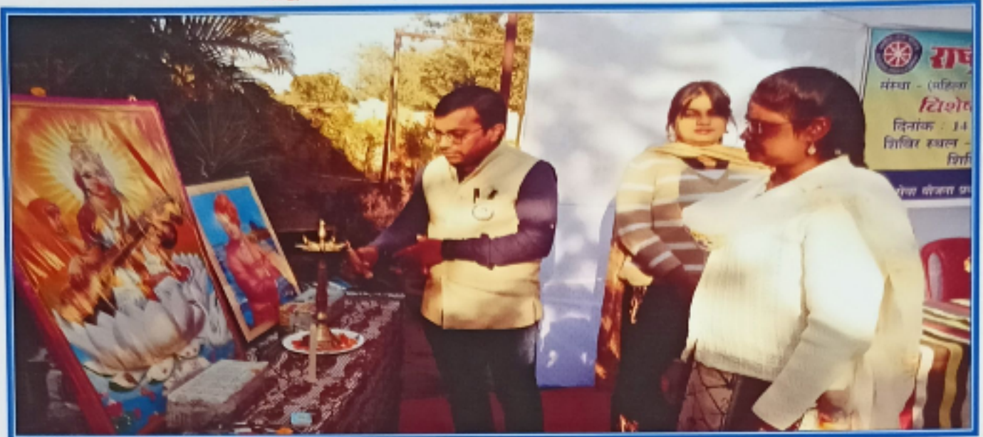
विधिक साक्षरता शिविर