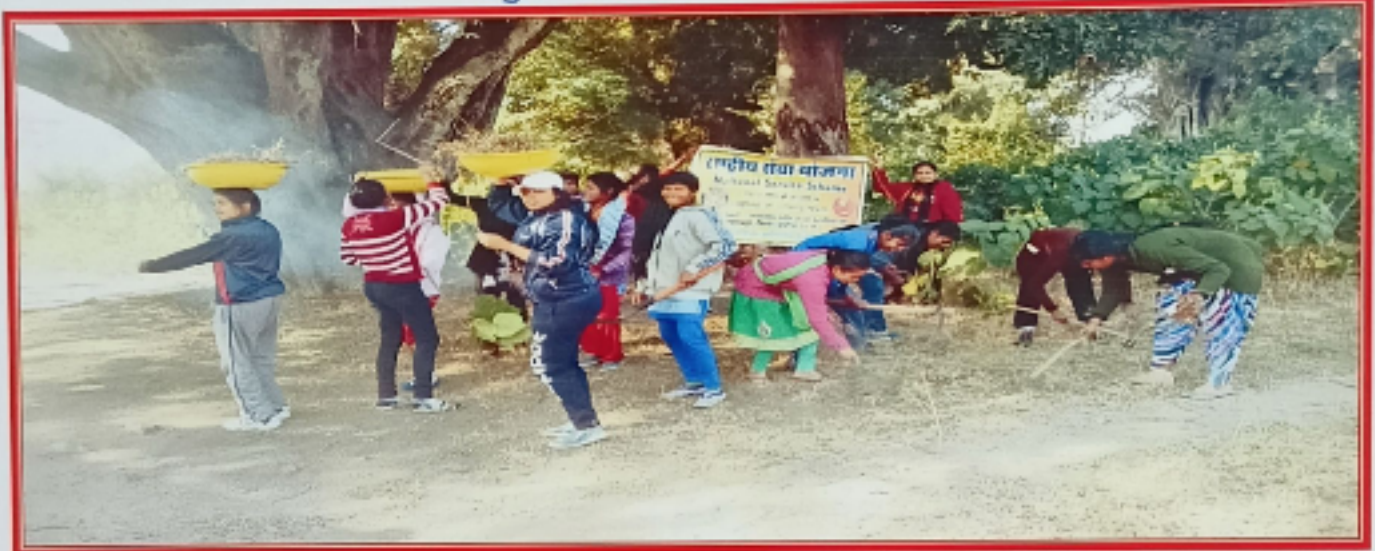
नगर रेलवे स्टेशन में स्वच्छता कार्य